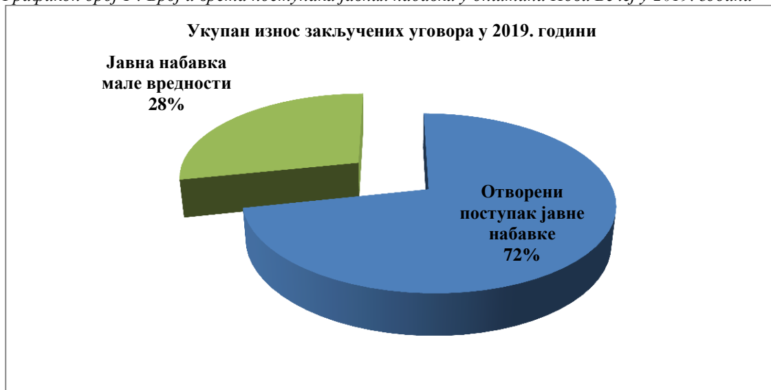
Графикон број 1 : Број и врста поступака јавних набавки у општини Нови Бечеј у 2019. години

Увидом у План набавки општине Нови Бечеј за 2019. годину, који је донео председник општине, као и податке прибављене у поступку ревизије од одговорних лица установљено је да је у општини Нови Бечеј: